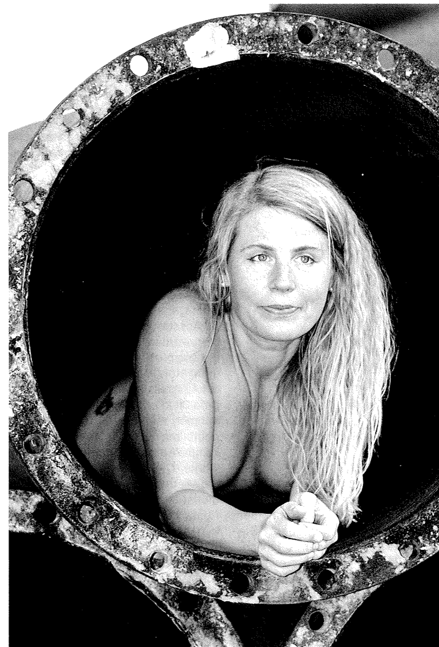
AKT, Foto: Mario-Moritzen

So ist es wohl auch schon vor Jahrhunderten gewesen. ■